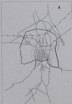
Η ενίσχυση των τειχών της πόλης και η ανασκαφή της πόλης. The fortification of Thebes in Mycenaean and historical times.