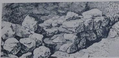
Τμήμα του μυκηναϊκού τείχους, όπως αποκαλύφθηκε την έσκαφη του 1915. Drawing of the Mycenaean fortification revealed in 1915 excavation at the "Proitides" site.