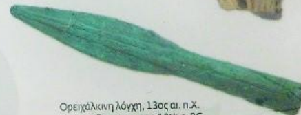
Ορειχάλκινη λόγχη, 13ος αι. π.Χ. Bronze spear, 13th c. BC