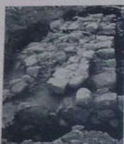
Τμήμα του μυκηναϊκού τείχους από την έσκαφη του 1915. A section of the Mycenaean fortification at Thebes, seen from the N.W.

ΧΑΡΤΗΣ ΤΗΣ ΚΑΔΜΕΙΑΣ ΜΕ ΣΗΜΕΙΩΜΕΝΗ ΤΗ ΘΕΣΗ ΤΜΗΜΑΤΩΝ ΤΗΣ ΜΥΚΗΝΑΪΚΗΣ ΟΧΥΡΩΣΗΣ MAP OF THE KADMEIA SHOWING THE LOCATION OF THE EXCAVATED SECTIONS OF THE MYCENAEAN FORTIFICATION