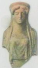
Πήλινα γυναικεία ειδώλια - προσφορές από το Θεσμοφόριο, 5ος-4ος αι. π.Χ. Clay women figurines - offerings from the Thesmophorion, 5th-4th c. BC

The aspect of cult practice of this place dates back to the Mycenaean time (13th c. BC). This is indicated by the objects that have been found in a thick destruction layer which contained bronze spearheads, a part of textile with many buttons made of steatite and the head from a clay figurine made on the potter's wheel.