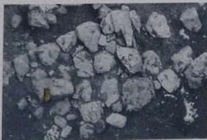
Το τμήμα όπου η υποθετική πρόταση του 1915 έγινε πραγματικότητα. The Mycenaean wall at the "Proitides" site as visible today from above (map no. 1).